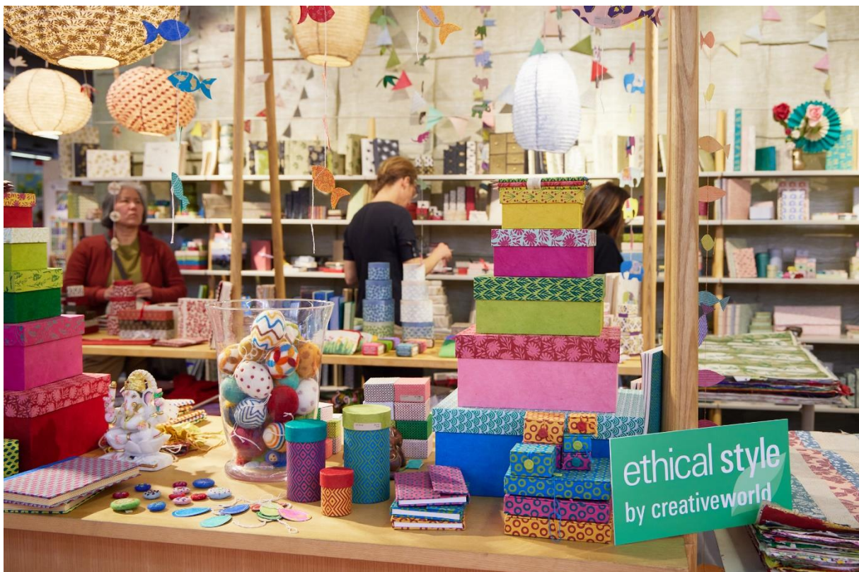
Special Interest Ethical Style by Creativeworld